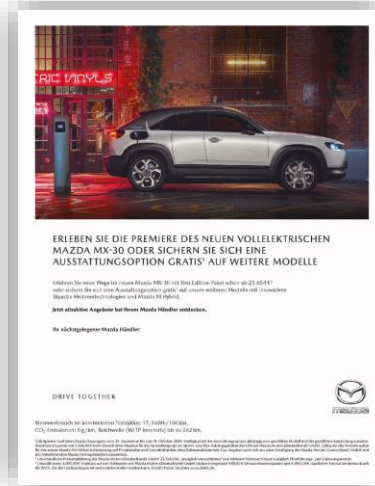
MAZDA – Mit Händlerintegration auf der 2us