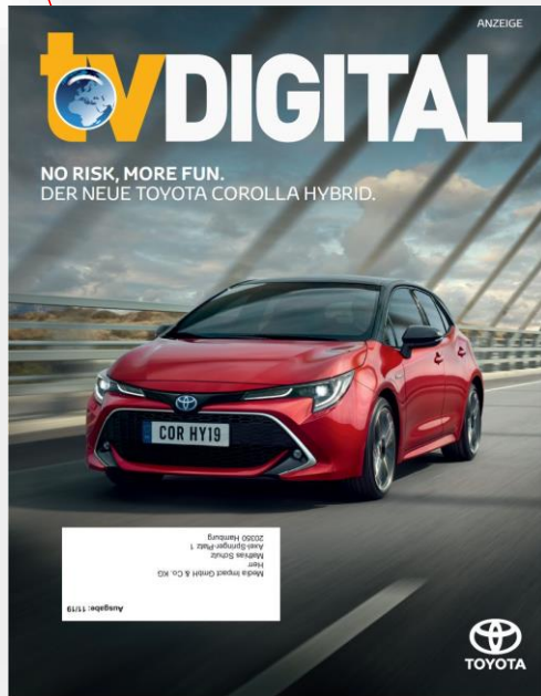
TOYOTA – Mit persönlicher Ansprache und Händlerzuordnung